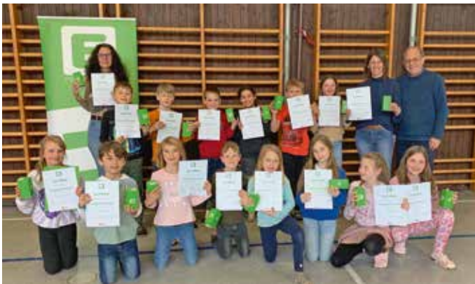
Dir. in Binderbauer, KL. in Stehring und Ing. Bai-erl mit den begeisterten Energieschlaumeiern der 3b-Klasse

derem mit der Energieeffizienz von Haushaltsgeräten, dem sparsamen Einsatz von elektrischer Energie und der Vermeidung von unnötigem Bereitschaftsverbrauch (Stand-by) bei Elektrogeräten schlaue auseinander. Krönender Abschluss des Projektes war wieder die Übergabe der begehrten Zertifikate an die neuen Energieschlaumeier.