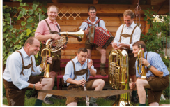
Gaal 6er Musi