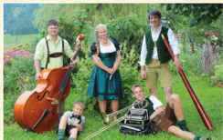
RiDuRi – Rinner Musi

Dabei führt heuer wieder einmal der beliebte ORF-Moderator Sepp Loibner durch das Programm. Die Freude am Musizieren, die Freude im Umgang mit dem Publikum sowie Spaß innerhalb der Gruppen stehen an diesem Abend im Mittelpunkt.