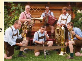
Die 6er Musi

abwechslungsreiches, bodenständiges Programm für Freunde der Volksmusik. Dabei führt der bekannte ORF-Moderator Daniel Neuhauser durch das Programm. Die Freude am Musizieren, die Freude im Umgang mit dem Publikum sowie Spaß innerhalb der Gruppen stehen an diesem Abend im Mittelpunkt.