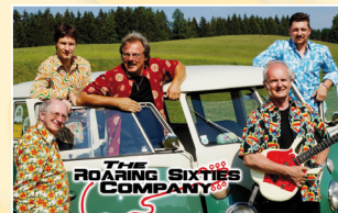
The Roaring Sixties Company

Top-Musiker der heimischen Musik- und Rockszene treffen sich noch einmal zu einer heißen Nacht unter dem Motto: „ Good times of Rock “. Info unter: www.spielberg.at