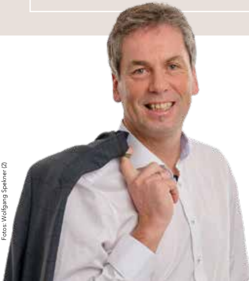
Manfred Lenger Bürgermeister